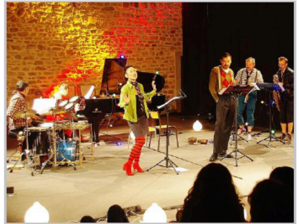
Une scène en formation variable avec voix et instruments.

un ensemble en mouvement bien dans son époque, le XXI e siècle « dans ses humeurs, ses rêves, ses perspectives, le n de son nom représentant les dimensions multiples dans lesquelles il veut développer son expression, inventer son art, affirmer son identité. »